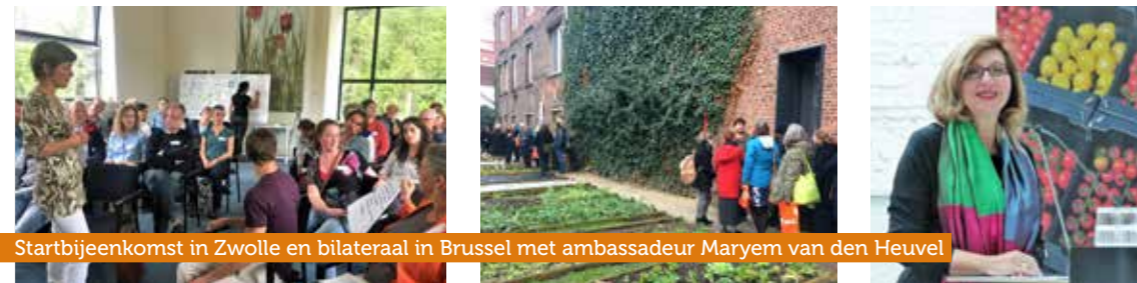
Startbijeenkomst in Zwolle en bilateraal in Brussel met ambassadeur Maryem van den Heuvel

In juni ging het kennisknooppunt officieel van start met een drukbezochte landelijke aftrap in Zwolle. Eind van het jaar volgde een succesvolle bilaterale sessie met onze burens in Vlaanderen. Samen met de Nederlandse ambassade in Brussel hebben we een programma opgezet om verder te ontdekken wat we van elkaar kunnen leren; op beleidsniveau, rond verdienmodellen en educatie. In 2018 krijgt deze interessante zoektocht een vervolg, dit keer in Leiden.