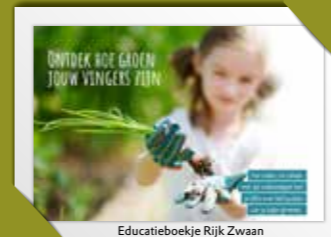
Educatieboekje Rijk Zwaan

actie om via het NME Netwerk en Jong Leren Eten de doelgroep te bereiken.